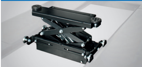
Achsheber für quattrolift